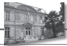
Sous-préfecture de Mirande