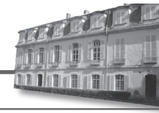
Sous-préfecture de Condom